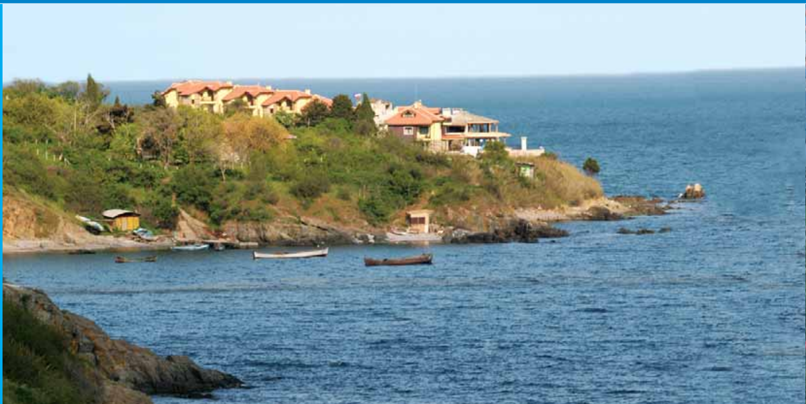
Οι περιοχές στο Bourgas και νοτιοανατολικά της χώρας αναπτύσσονται ραγδαία